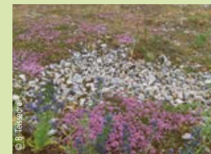
Thym serpolet en fleurs

Au printemps, le paysage se teinte de couleurs chatoyantes. Les minuscules fleurs mauves du Thym serpolet rivalisent avec les pétales jaunes du Pavot cornu, sorte de coquelicot. Rares et fragiles, ces fleurs sont protégées : ne les cueillez pas et ne les piétinez pas.