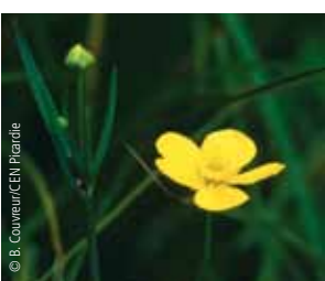
La Grande Douve, un grand bouton d'or de plus d'un mètre de haut, est une espèce protégée par la loi. Les travaux de déboisement ont fortement favorisé cette plante typique des marais.

Le point de départ du parcours se situe au parking de l'église de Blangy. En prenant la rue du Mail, vous accédez à l'entrée du site depuis le sentier situé entre les n°s 33 et 37. Un panneau d'accueil vous invite à suivre le sentier sur la droite. En marchant jusqu'à l'étang Lapière, vous découvrirez les paysages caractéristiques du marais : bois de bouleaux, fourrés de saules, friches humides, etc. Depuis les rives de l'étang Lapière, vous observerez des herbiers flottants, témoins d'une eau de qualité. De nombreux tremblants, sortes de radeaux