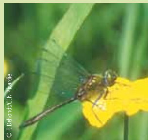
Cordulie bronzée , sur une Grande Douve : une fois sa vie aquatique terminée, la larve de la libellule grimpe le long d'une tige pour son émergence.

234 plantes supérieures ont été recensées sur le site. Parmi elles, 34 sont rares et exceptionnelles en Picardie et 9 sont protégées. Une dizaine d'espèces de sphaignes (mousses des tourbières acides) ont colonisé les milieux humides et en font l'un des sites les plus riches de la région.