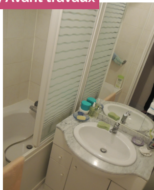
» Avant travaux