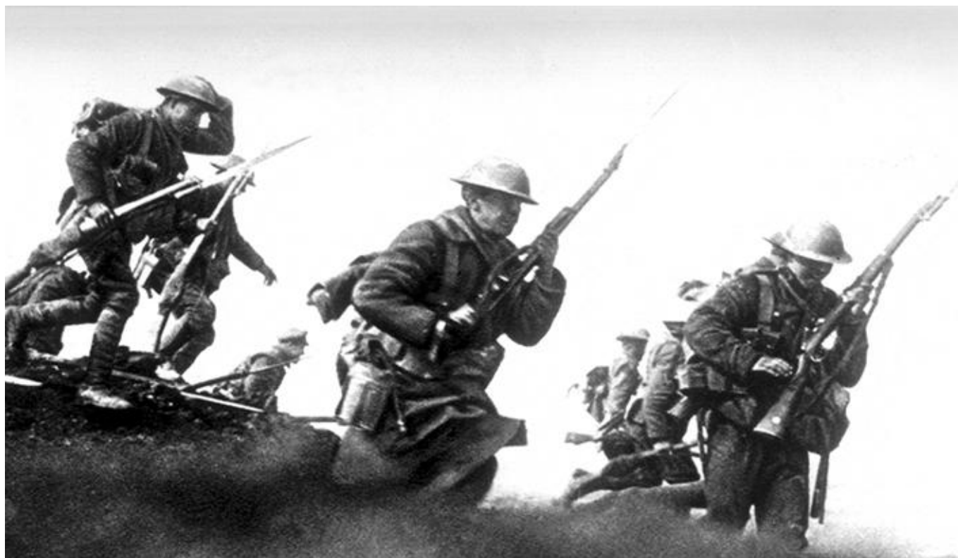
Canadiens donnant l'assaut et quittant les tranchées. Somme, 1916.

Aujourd'hui, les paysages ont retrouvé leur douceur. Les coquelicots poussent à nouveau sur les talus, et les enfants jouent là où les obus tombaient. Mais dans chaque silence, dans chaque pli de terre, la mémoire veille. Car ici, au cœur de la Somme, la paix porte toujours le visage des courageux tombés en 1916.