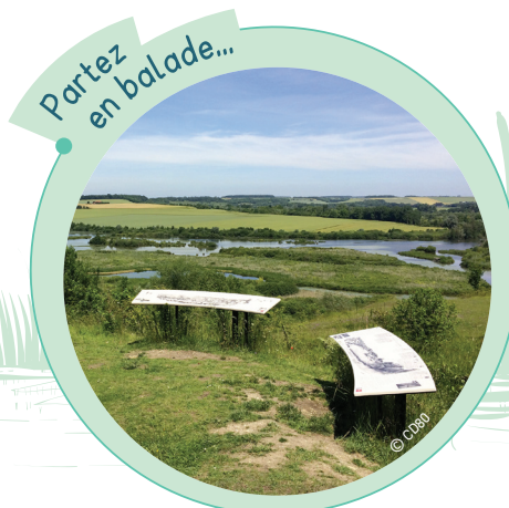
Partez en balade...

À proximité immédiate, découvrez des vues plongeantes depuis le haut des larris de Frise ou de la Montagne de Vaux. Des tables d'interprétation vous guideront dans la lecture de ces paysages magnifiques. Pensez également à réserver votre sortie nature accompagnée par un guide agréé Qualinat sur : https://www.sortie-nature.fr .