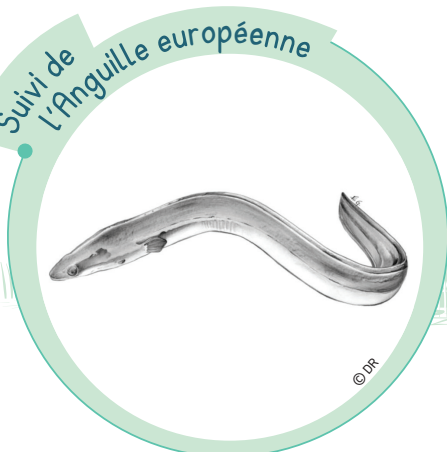
Suivi de l'Anguille européenne

Grâce au partenariat entre le Département, l'Agence de l'Eau Artois Picardie et la Fédération de la Somme pour la pêche et la protection du milieu aquatique, l'anguillière d'Éclusier-Vaux sert aujourd'hui au suivi de l'Anguille européenne. Les anguilles sont ainsi capturées, dénombrées, mesurées, étudiées puis relâchées.