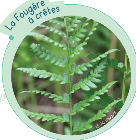
La Fougère à crêtes

La Fougère à crêtes, très rare en France, possède, dans les tourbières de la vallée de la Somme, ses plus importantes populations de tout le pays.