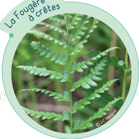
La Fougère à crêtes

La Fougère à crêtes, très rare en France, possède, dans les tourbières de la vallée de la Somme, ses plus importantes populations de tout le pays.