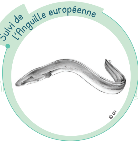
Suivi de l'Anguille européenne

Grâce au partenariat entre le Département, l'Agence de l'Eau Artois Picardie et la Fédération de la Somme pour la pêche et la protection du milieu aquatique, l'anguillière d'Éclusier-Vaux sert aujourd'hui au suivi de l'Anguille européenne. Les anguilles sont ainsi capturées, dénombrées, mesurées, étudiées puis relâchées.