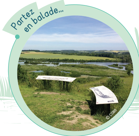
Partez en balade...

À proximité immédiate, découvrez des vues plongeantes depuis le haut des larris de Frise ou de la Montagne de Vaux. Des tables d'interprétation vous guideront dans la lecture de ces paysages magnifiques. Pensez également à réserver votre sortie nature accompagnée par un guide agréé Qualinat sur : https://www.sortie-nature.fr .