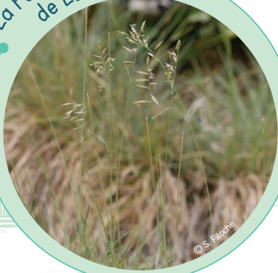
La Fétuque de Léman

La Fétuque du Léman, de la famille des poacées (ex graminées), forme de petites touffes à feuilles très fines. Elle est assez rare et s'observe sur des sols pauvres.