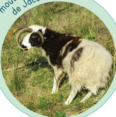
Les moutons de Jacob

Le mouton de Jacob est une race rustique parfaitement adaptée pour la gestion écologique de sites embroussaillés. Sa particularité est qu'il dispose de 4 cornes, celles des mâles étant plus développées.