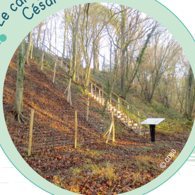
Le camp César

Le rempart sur lequel ont été mis en place les belvédères, constitue la partie la mieux conservée d'un ensemble plus vaste qui servait de place forte romaine. Installée sur un promontoire naturel et encadrée par 4 vallées sèches ou humides, formant des obstacles naturels à l'invasisseur, cette place forte était idéale pour la défense militaire.