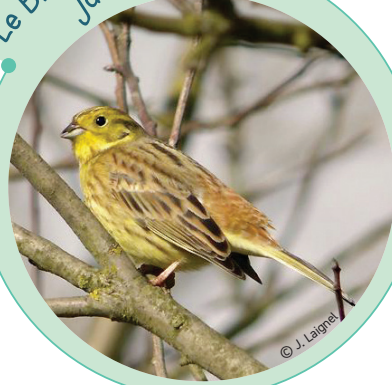
Le Bruant jaune

Le Bruant jaune est un oiseau de l'ordre des passereaux. Il apprécie les zones proches des cultures car il se nourrit de graines. Au printemps, les mâles chanteurs ont pour habitude de se placer à la cime des arbres pour lancer leur cantonade.