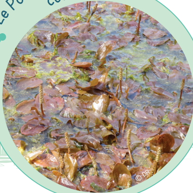
Le Potamot coloré

Plante protégée caractéristique des tourbières alcalines de la Vallée de la Somme, elle forme des herbiers aquatiques et se développe dans les eaux stagnantes.