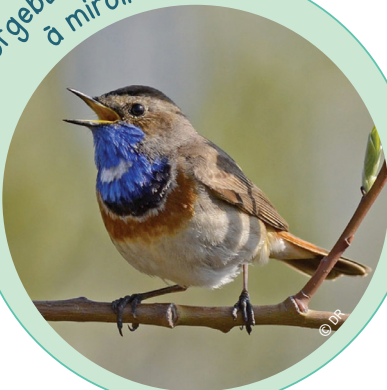
La Gorgebleue à miroir

La Gorgebleue à miroir se nourrit d'insectes. Elle hiverne principalement au nord de l'Afrique. Elle aime faire son nid dans une touffe d'herbes ou un buisson touffu. Des individus ont été entendus en 2021.