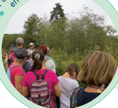
Partez en balade...

Un parcours libre permet de découvrir le site en traversant différents milieux : coteaux calcaires et boisements humides. Un secteur de découverte complémentaire, plus sensible, d'environ 700 mètres, est réservé aux visites encadrées par des guides nature agréés Qualinat. Vous pouvez réserver votre sortie accompagnée directement sur le site de l'association : https://www.sortie-nature.fr .