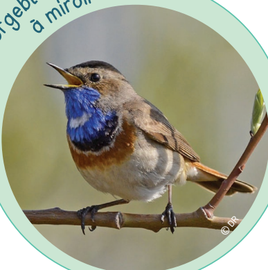
La Gorgebleue à miroir

La Gorgebleue à miroir se nourrit d'insectes. Elle hiverne principalement au nord de l'Afrique. Elle aime faire son nid dans une touffe d'herbes ou un buisson touffu. Des individus ont été entendus en 2021.