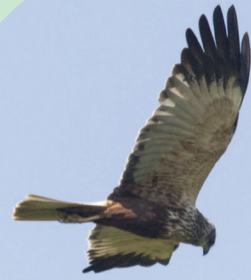
Le Busard des roseaux

C'est une espèce migratrice, protégée en Europe et menacée dans la région par le dérangement humain et la régression des roselières. Le Busard des roseaux niche dans les vastes roselières gorgées d'eau.