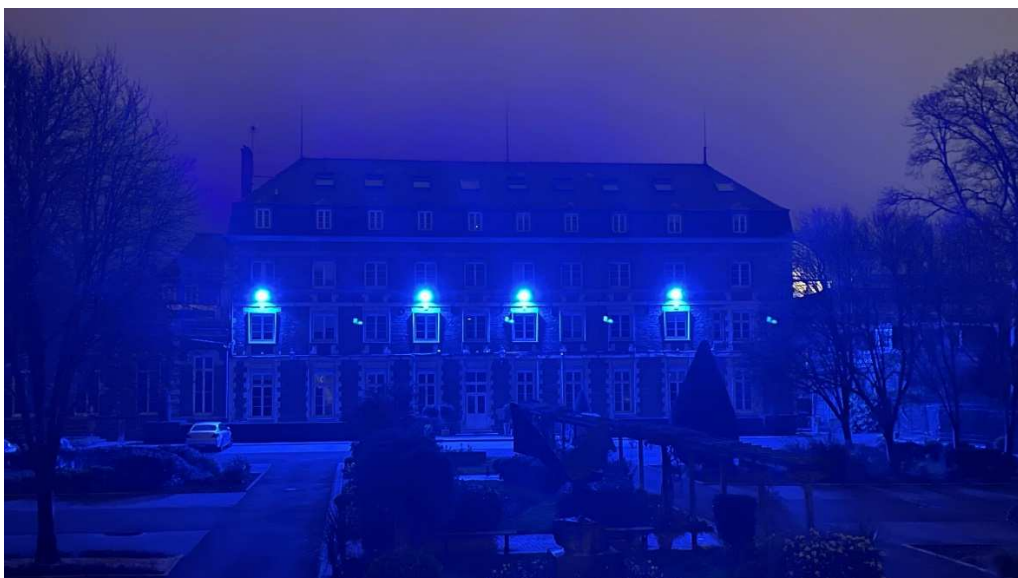
Façade et cour de l'Hôtel des Feuillants, siège du Conseil départemental de la Somme