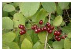
Camerisier à balai