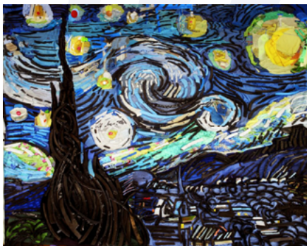
Nuit étoilée - Bernard Pras - 2010

Visite libre à la lampe torche (en prêt sur place) de 18h à 22h