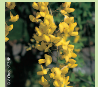
Au printemps, le Cytisus faux ébénier arbore de magnifiques grappes de fleurs jaunes

Sur le site, pâturent une cinquantaine de brebis qui participent activement à l'entretien de l'herbage. Il faut également compter sur les nombreuses interventions de débroussaillage complémentaire menées par le Conservatoire des sites naturels de Picardie en partenariat avec l'éleveur, la commune, des bénévoles, mais aussi et surtout depuis 2003, avec le chantier d'insertion d'ADI Somme.