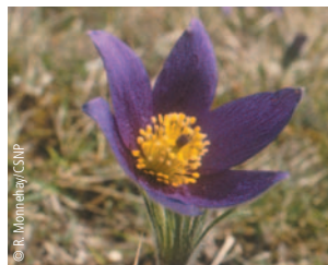
Les floraisons d'Anémone pulsatille en mars-avril sont ici très spectaculaires.

Au printemps, les pelouses sont couvertes de tapis de fleurs grâce aux espèces caractéristiques du milieu : les Hippocrépides jaunes en ombelle, la Globulaire bleue et les Anémones pulsatilles aux pétales pourpres. On compte six variétés d'orchidées sauvages, comme l'Orchis mouche ou l'Orchis pourpre.